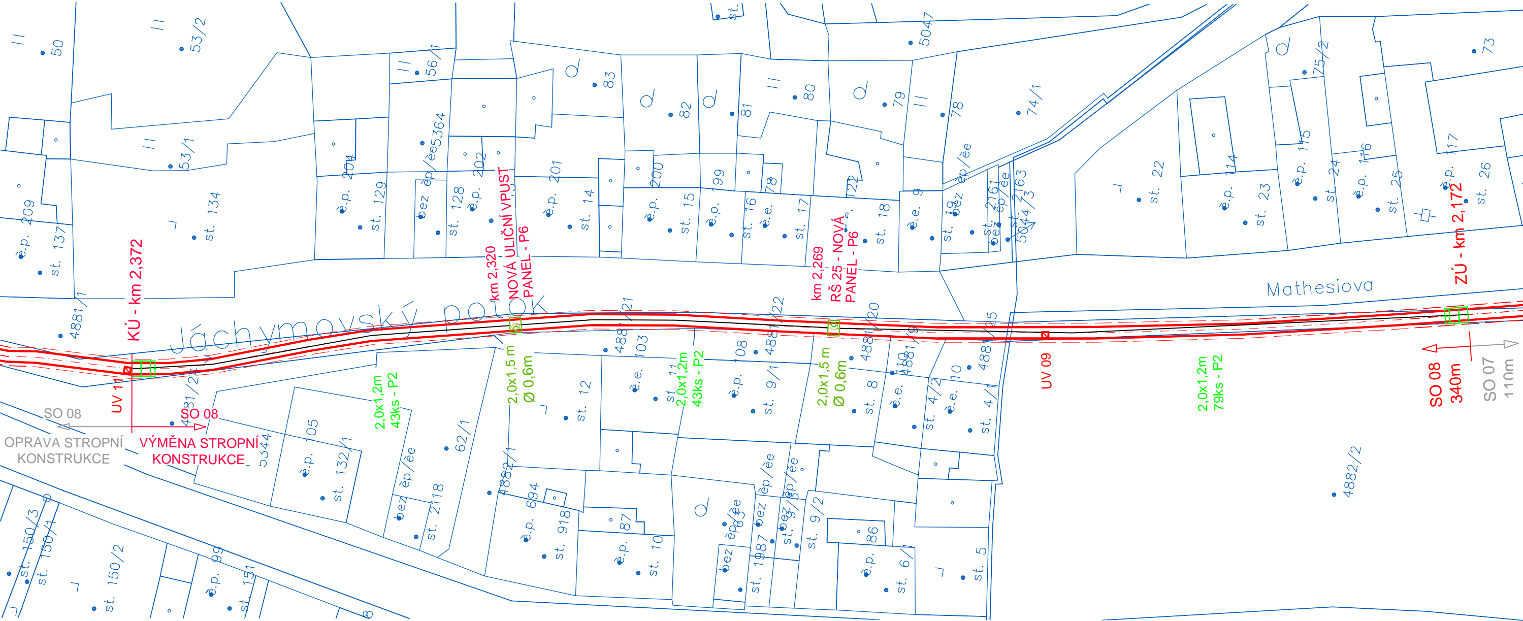
VÝPIS PANELŮ PRO SO 08